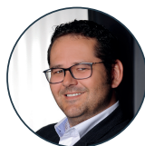
Ernst Edelmann Bürgermeister von Wimpassing