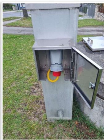
Einhausung Notstromanschluss Brunnen II

Zahlreiche Instandhaltungs- und Reparaturmaßnahmen wurde von den Gemeindearbeitern in Eigenregie durchgeführt. Somit müssen wir keine Fremdfirmen beauftragen und können damit erhebliche Kosten sparen. Es zeigt auch die hohe Professionalität und den Ausbildungsgrad unserer Mitarbeiter als Facharbeiter.