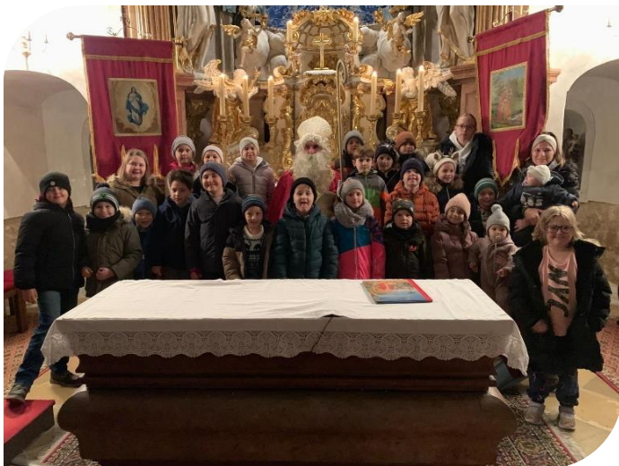
Nikolausfeier in der Kirche