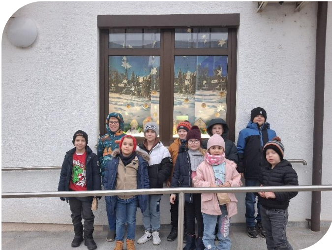
Adventfenster der Gemeinde