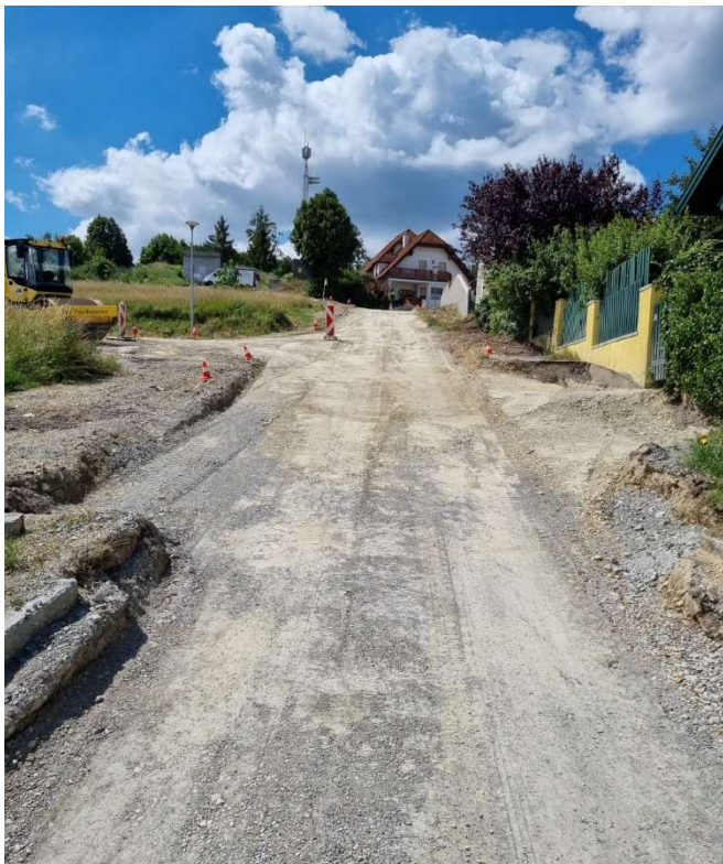
Straßensanierung Teilstück Waldgasse / Weidegasse