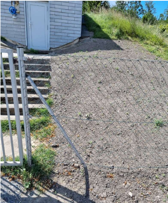
Erneuerung Füllleitung Hochbehälter (Austausch alte AZ-Leitung in PE)