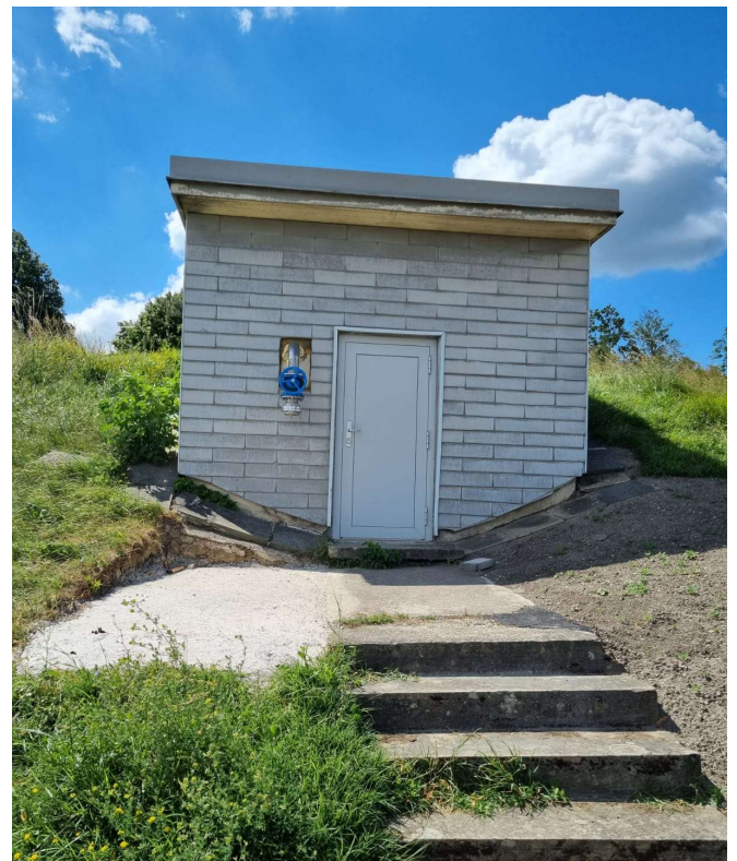
Errichtung eines FF-Anschlusses am Hochbehälter zur Erhöhung des Brandschutzes