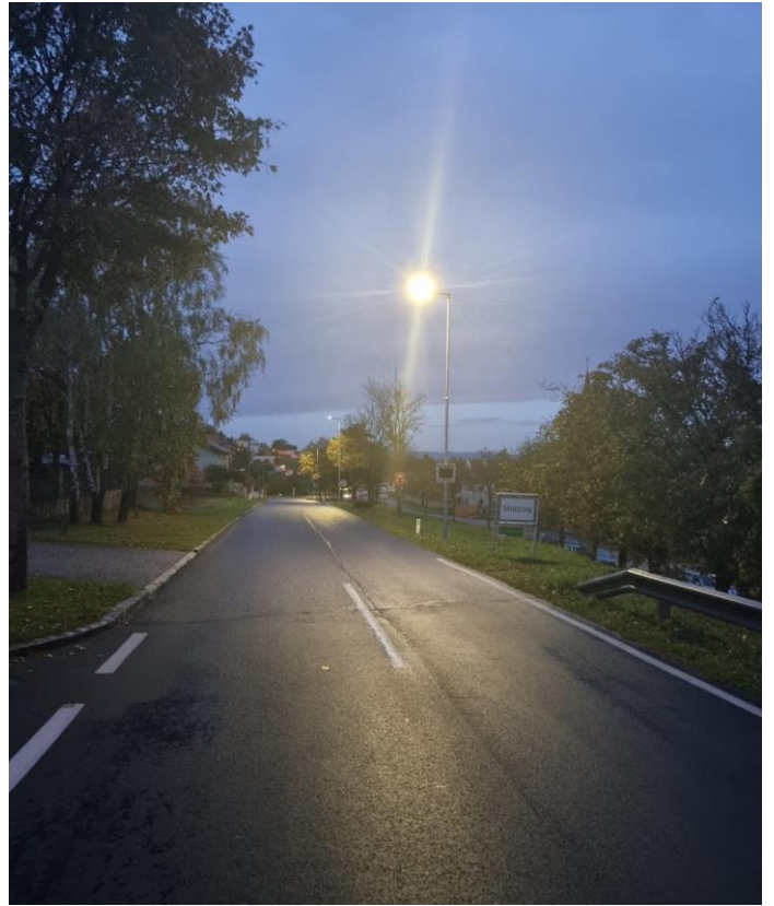
Umrüstung auf energiesparende LED-Beleuchtung entlang der Eisenstädter Straße