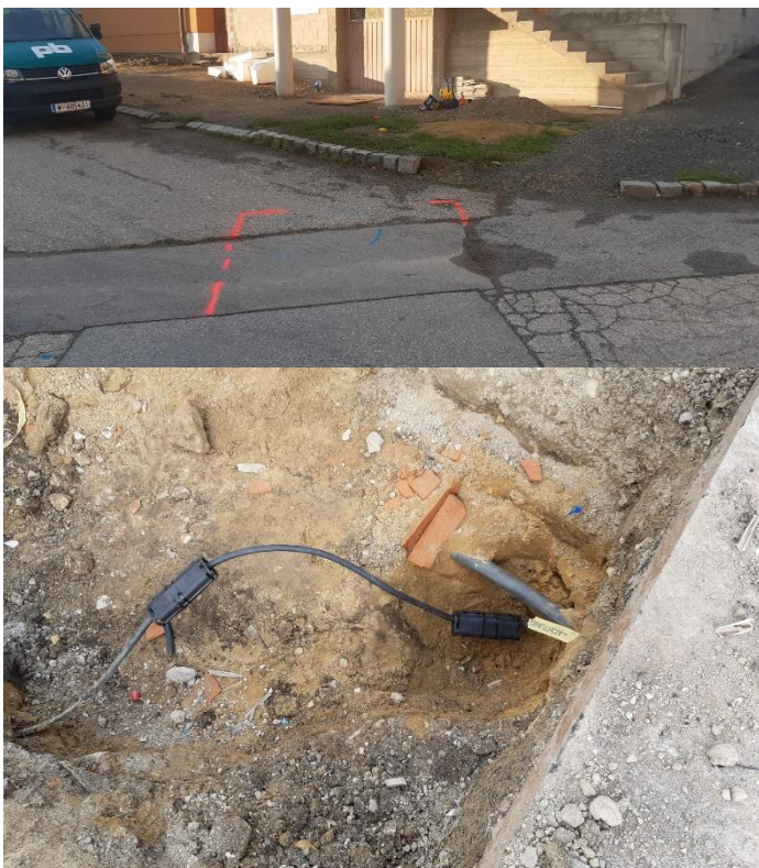
Sanierung Erdverkabelung der Straßenbeleuchtung in der Dreifaltigkeitsgasse