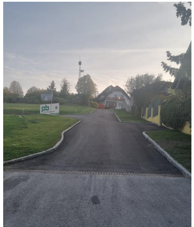
Fertigstellung Straßensanierung Teilstück Waldgasse / Weidegasse