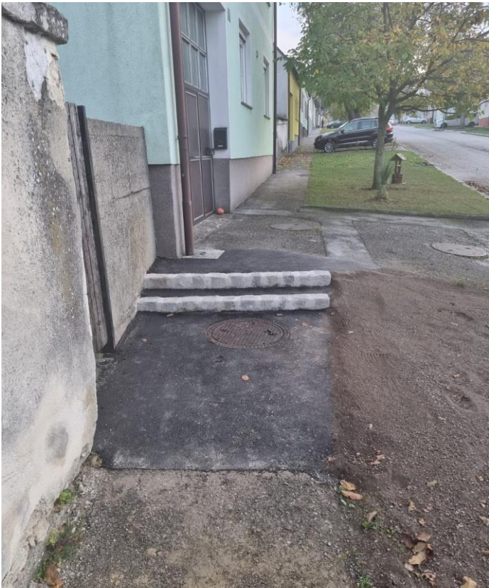
Gehsteig- und Kanaldeckelsanierung Ecke Hofstatt zur Feldgasse